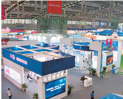
沪京杭成外国人眼中最具吸引力的中国城市

4月16日，国产大飞机C919在上海浦东国际机场4号跑道进行首次高速滑行测试。当日，国产大飞机C919在上海浦东国际机场4号跑道进行了首次高速滑行测试，测试顺利，跑道高速测试是大飞机首飞前的最后一关。目前，首飞前的各项技术测试工作正在有条不紊的展开。