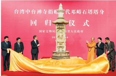
被盗19年唐代石塔塔身由台捐赠返晋

4月15日，在深圳举行的第十五届中国国际人才交流大会（见上图）上，2016“魅力中国—外籍人才眼中最具吸引力的中国城市”评选结果发布，上海、北京、杭州、青岛、天津、深圳、苏州、广州、南京和长春获选。