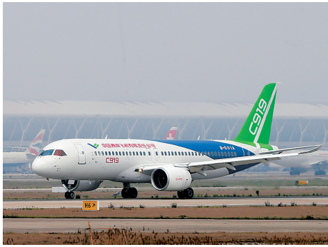
国产大飞机C919完成首次跑道高速滑行测试

4月16日，国产大飞机C919在上海浦东国际机场4号跑道进行首次高速滑行测试。当日，国产大飞机C919在上海浦东国际机场4号跑道进行了首次高速滑行测试，测试顺利，跑道高速测试是大飞机首飞前的最后一关。目前，首飞前的各项技术测试工作正在有条不紊的展开。