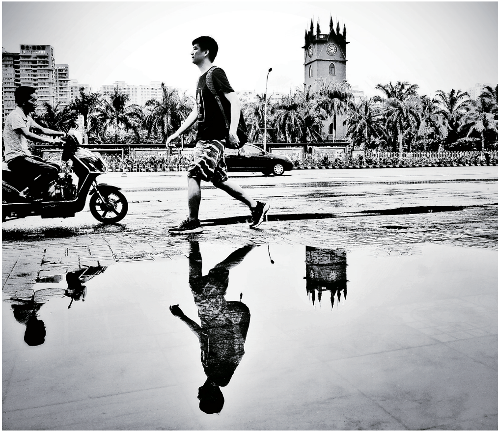
海口长堤路上,路人走过雨后积水的路面。