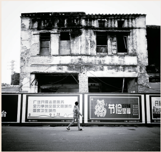
海口新华南路上,年轻人抬头看正在改造的老房子。