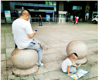
海口高铁东站内的大人和孩子。