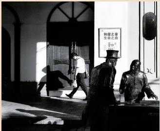
一位年轻人提早餐穿过骑楼老街。