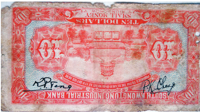
背面印反了的“拾圆”毫洋

阿拉伯数字外,其余文字皆为英文,中间是园林、建筑图案,两侧有两个数字“1”,字体比四角的大出一倍,左下方和右下方有行长、副行长手写的英文签名。