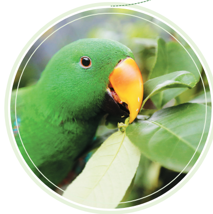
鹦鹉“绿豆”在咬香柠檬。