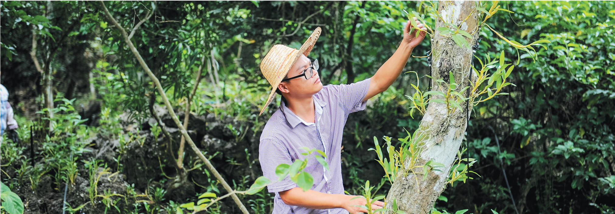
植石斛发展特色产业。 施茶村村民在基层党组织的带领下种