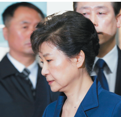
3月30日朴槿惠到达首尔中央地方法院的资料照片。