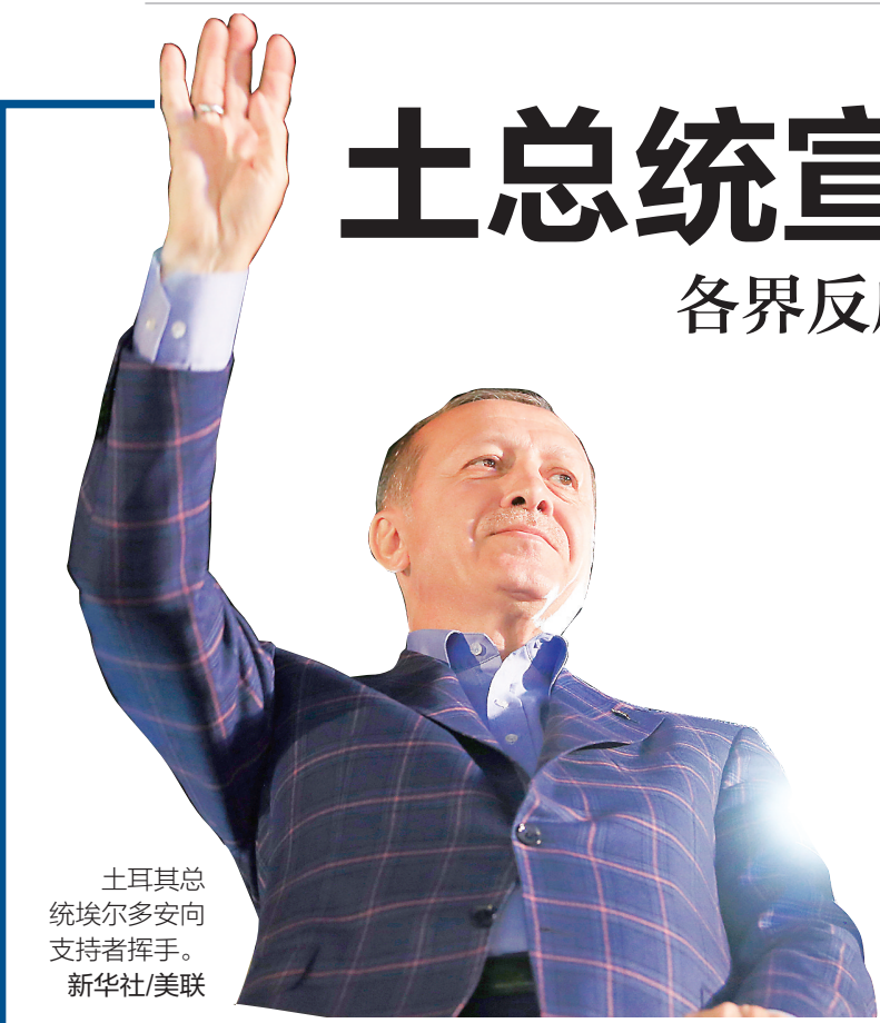
土耳其总统埃尔多安向支持者挥手。

据新华社安卡拉4月17日电(记者秦彦洋 施春)土耳其总统埃尔多安16日夜间宣布,执政党正义与发展党和支持者力推的修宪草案在当天举行的全民公投中获得通过。修宪支持者走上街头庆祝,反对党表示公投存在不当行为,要求重新统计部分选票。