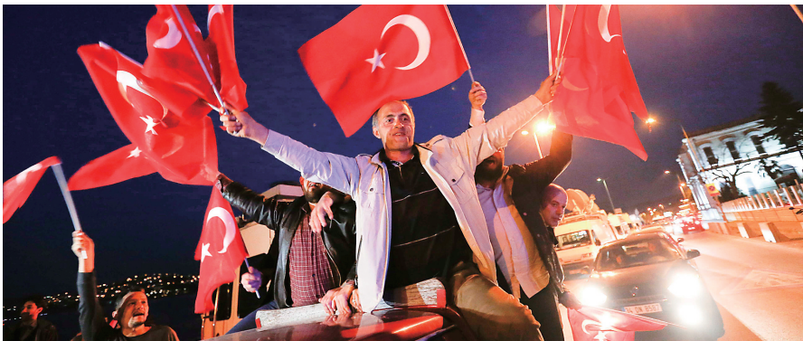
4月16日,在土耳其伊斯坦布尔,修宪支持者挥舞旗帜庆祝。