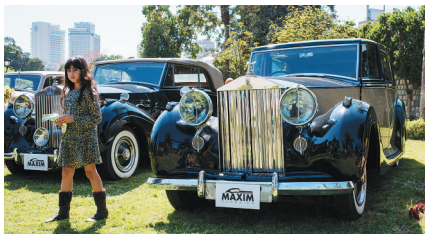
老式劳斯莱斯汽车