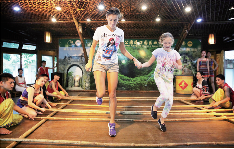
俄罗斯游客在跳竹竿舞。

按照“航班开到哪,宣传促销就到哪”的原则,去年,海南旅游促销团赴俄开展多项宣传促销活动,包括参加中俄旅游论坛、第22届莫斯科国