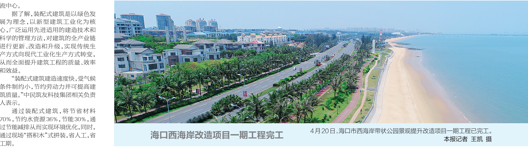
海口西海岸改造项目一期工程完工

通知要求,各党委(党组)要保证电话、信访、网络和短信“四位一体”的综合举报受理平台24小时畅通,向广大干部群众公开举报电话,即时受理违反换届纪律问题举报,实时监测和了解辖区和本单位的换届风气情况,把纪律和规矩挺在前面,从讲政治的高度强化监督执纪问责,以“零容忍”的态度正风肃纪,要坚持抓早、抓小、抓现行,对顶风违反换届纪律的问题,发现一起、坚决查处一起、及时通报曝光一起,有效发挥查办案件的警示震慑作用,持续释放执纪必严的强烈信号。