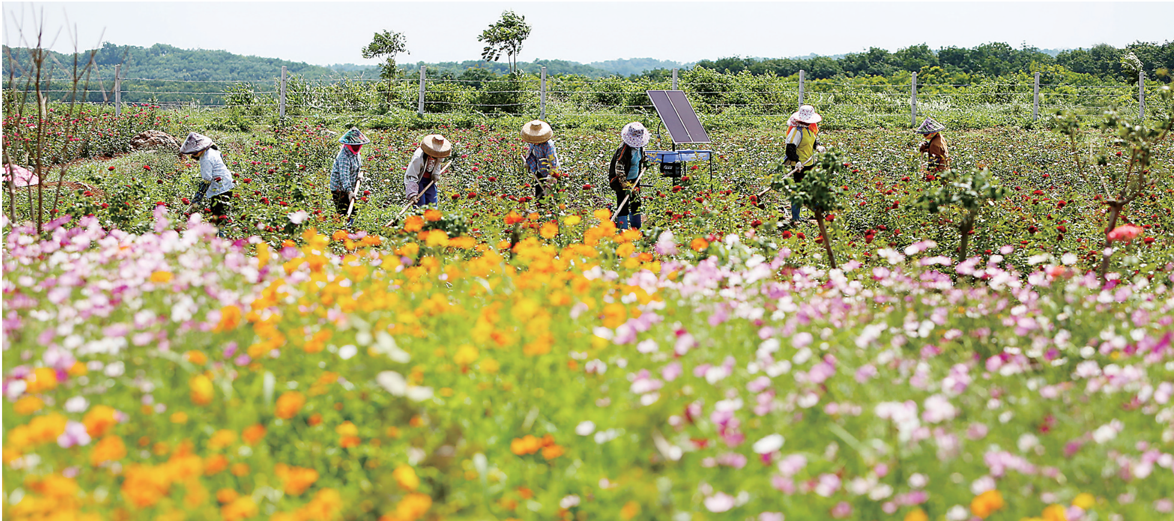
儋州爱尚玫瑰园带动农民增收。