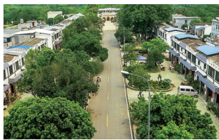
儋州石屋村新貌。