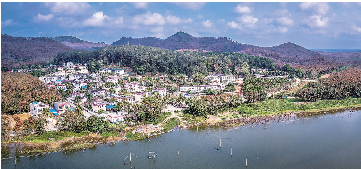
儋州市美万新村美景宜人。

不破坏植被，利用原生态地形地貌。屋基村玫瑰观光产业园项目规划实施，充分利用山水田林路原生态地貌，将生产、加工、展示等功能区规划在平整的农田，将低洼地改造成供鹭鸶栖息的生态地带，将玫瑰酒庄休闲观光功能区规划在水渠地带，最大限度地利用和保护农田、村落、湿地的原生态地形地貌。