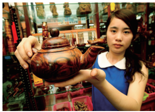
儋州市铁匠村发展花梨加工产业。