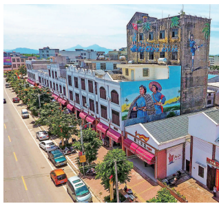
琼海市阳江镇街角。