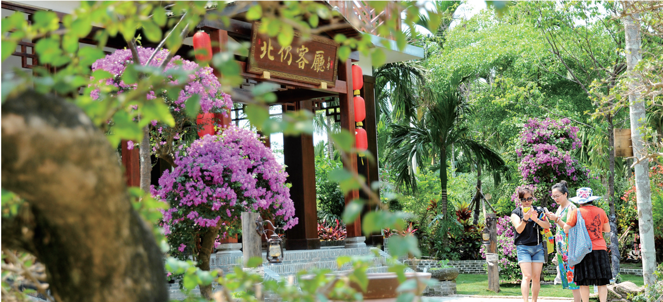
美丽的琼海北仍村。(资料图)