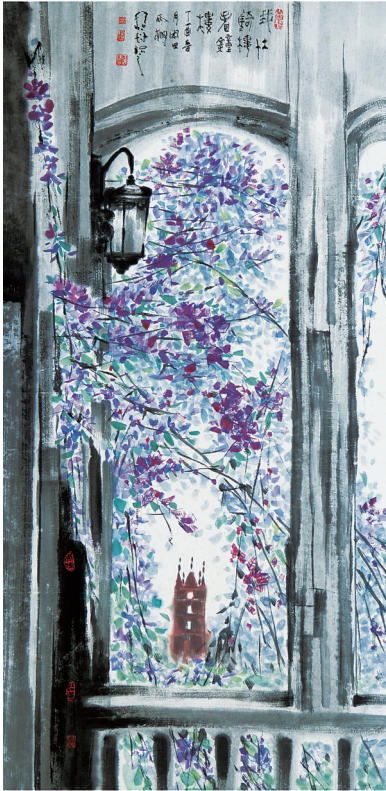
《我在骑楼看钟楼》 王隽珠