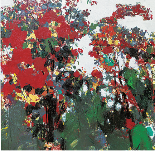
《三角梅季节》 陈和西