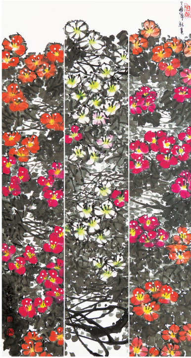
《南国春永驻》 易至群