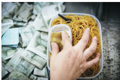
每名点钞员工作台前的橡皮筋盒。