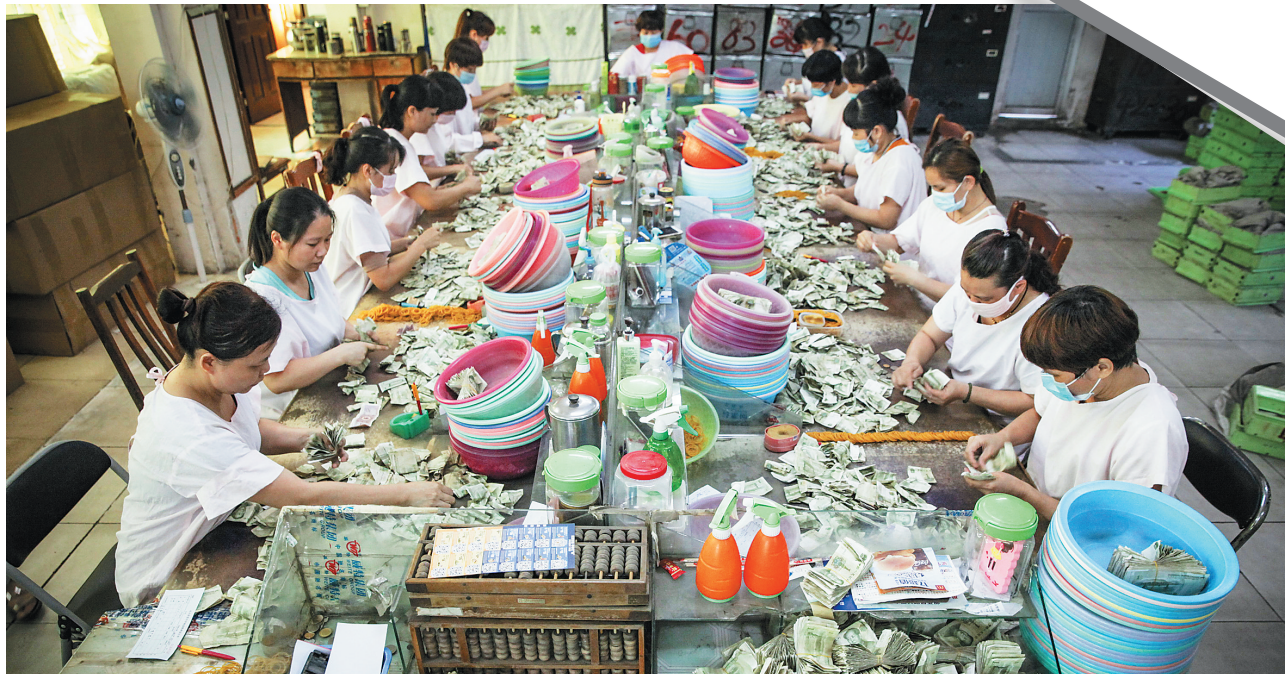
点钞“娘子军”聚精会神数钞票。