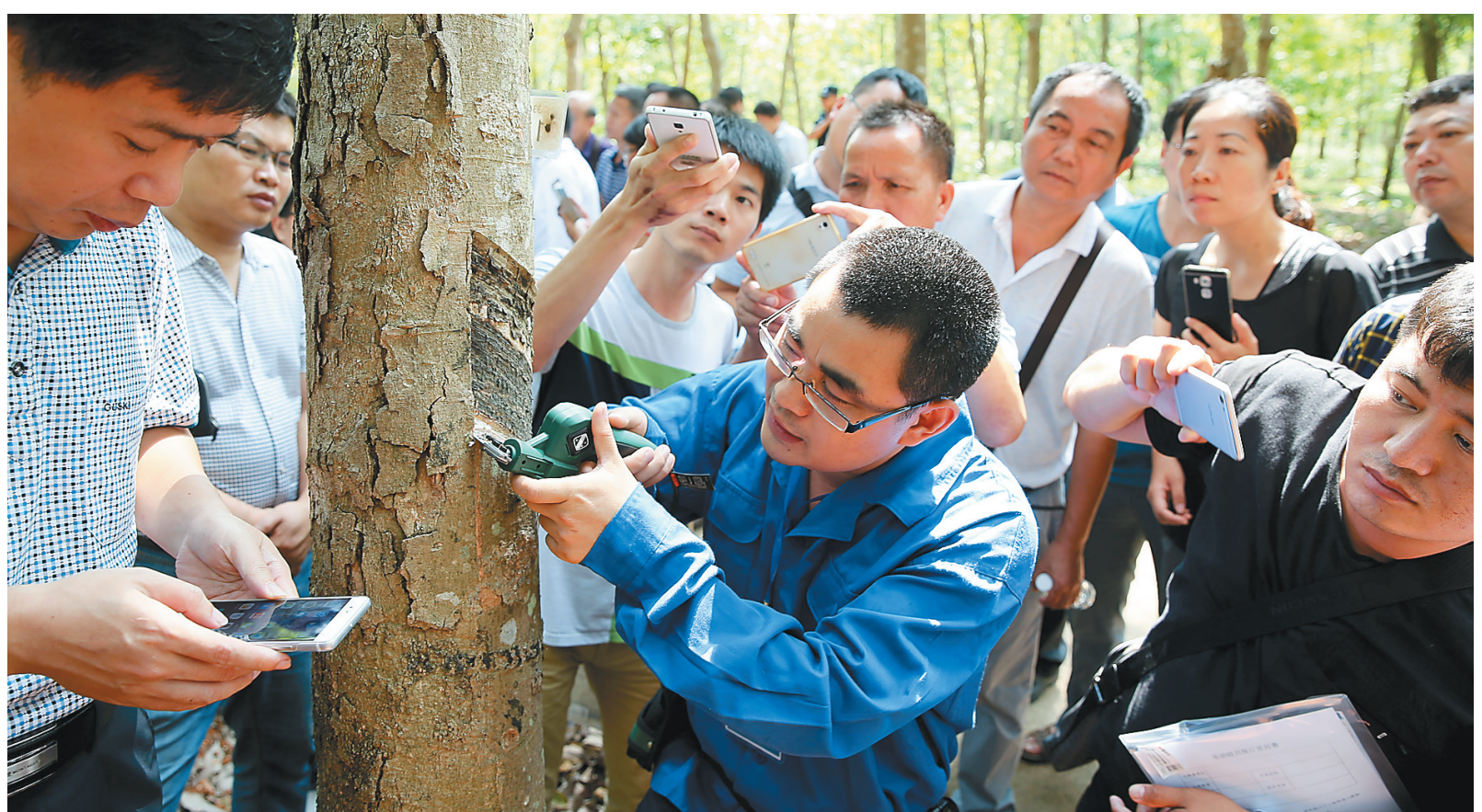
4月25日，参加4GXJ-1型锂电电动胶刀新闻发布会暨产品推介会的嘉宾，在儋州热科院试验场胶林里体验电动胶刀割胶。