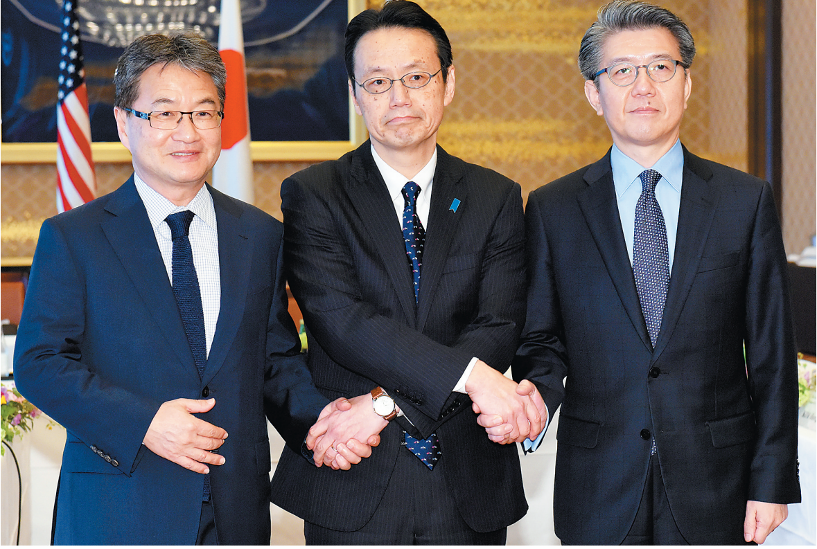
4月25日，在日本东京，（从左至右）美国国务院朝鲜政策特别代表尹汝尚、日本外务省亚洲大洋洲局局长金杉宪治和韩国外交部半岛和平交涉本部长金烘均握手。三方代表讨论共同应对朝鲜半岛问题。

美国总统特朗普24日说，联合国安理会必须准备好对朝鲜实施新一轮制裁。 特朗普当天在白宫与安理会成员国常驻联合国大使会面时表示，朝鲜半岛的现状是“不能接受的”，联合国安理会必须准备好就朝鲜核项目和弹道导弹项目实施额外的、更强有力的制裁。 特朗普并未表明他认为联合国安理会应何时追加对朝制裁。美国媒体此前援引美匿名官员话说，美国白宫已经进行过内部讨论，商讨是否将追加制裁作为对朝鲜今后进行导弹试射和新核试验的回应。