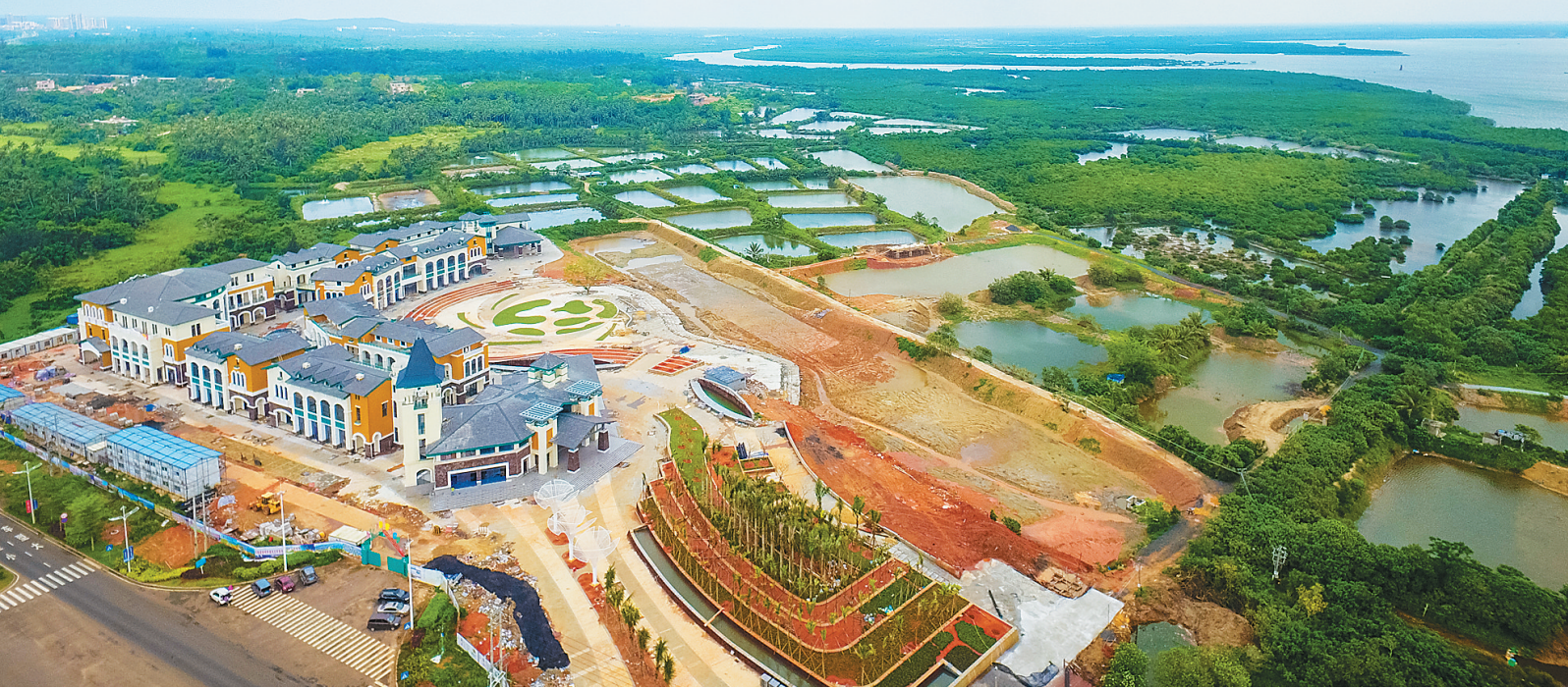
文昌八门湾海上森林公园国庆开园