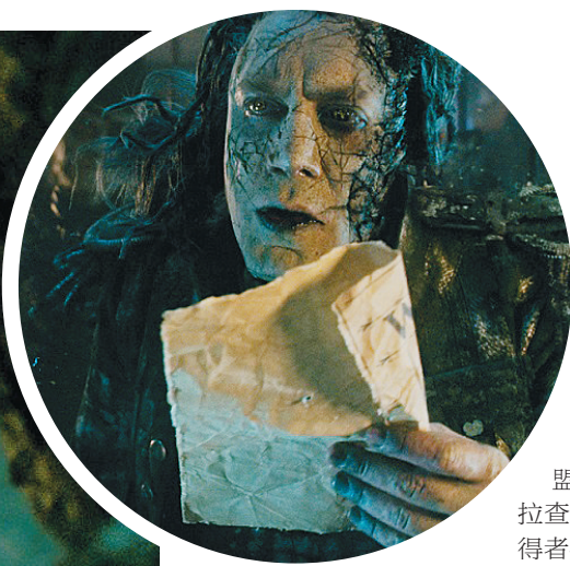
上图:哈维尔·巴登饰演的萨拉查船长