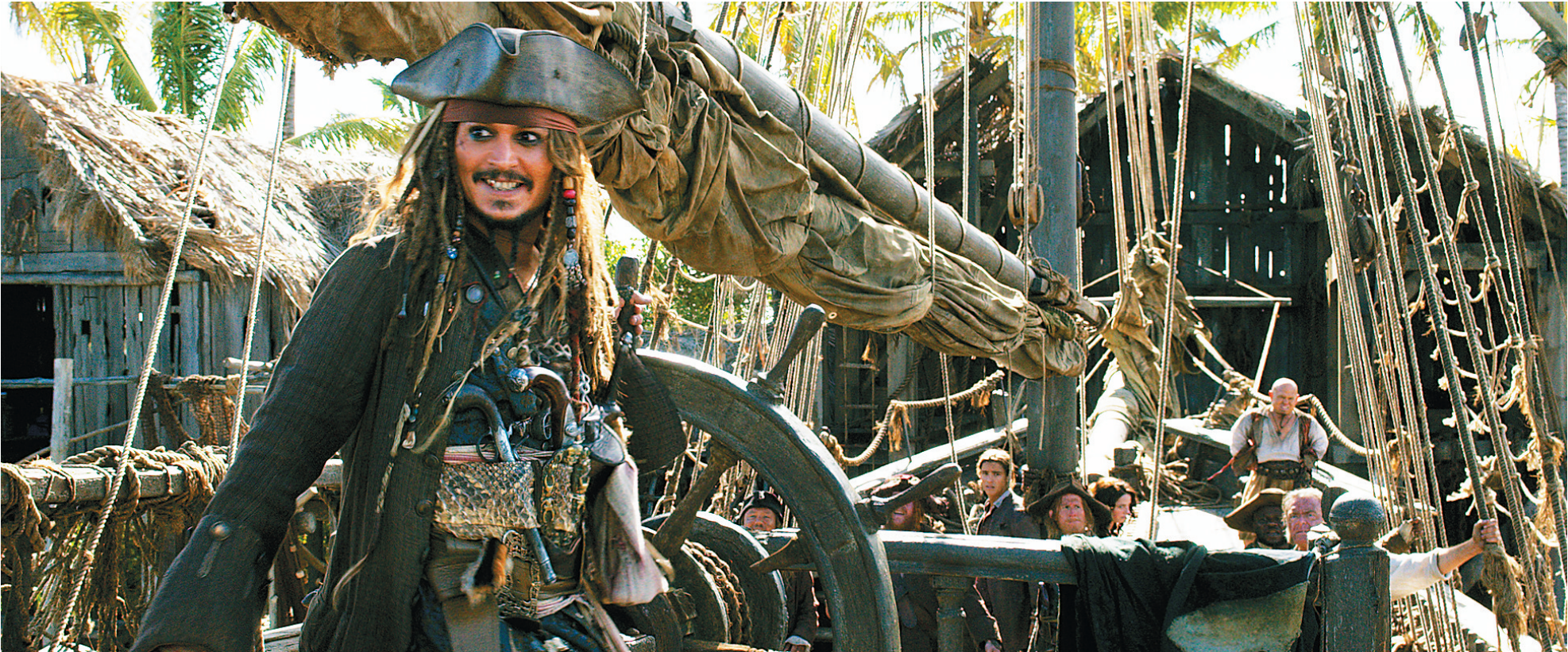
约翰尼·德普(左)在《加勒比海盗5:死无对证》中