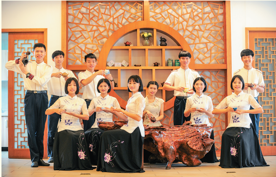
海口旅游职业学校茶艺实训室。