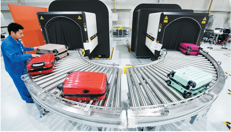
在位于北京密云的 同方威视技术股份有限公司 内，工作人员在调试一套安检设备

同方威视董事长陈志强说，密云生产基地刚建设时，有人认为基地“太大了，用不了”，而现在连巴西、波兰都有了工厂，当地生产，全球销售，不仅促进了所在国就业，更改善了当地民生。