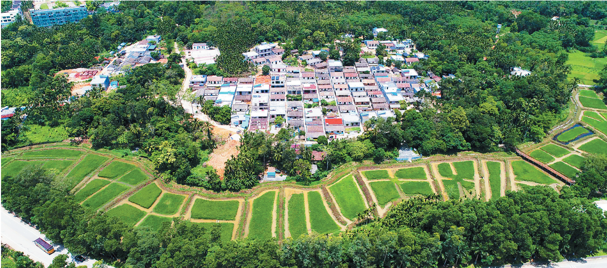
5月7日,航拍琼中黎族苗族自治县湾岭镇鸭坡村。

山里的孩子见惯了繁星点点,对外面的世界却是“充满想象”。接下来,共享书房将组织在校大学生定期为孩子们讲故事,培养一批“周末小书童”,让大家在书的海洋里遨游。