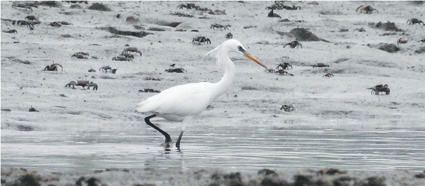
在海口东寨港国家级自然保护区滩涂上踱步觅食的黄嘴白鹭。