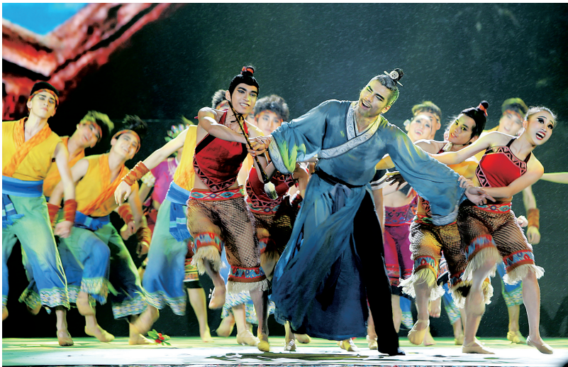
2016年11月9日晚,舞剧《东坡海南》在儋州东坡书院举行惠民演出时的剧照。

观众欣赏到了海南油画家笔下的海南之美。 据悉,本次展览将持续到6月17日。期间,来自海南的19名参展油画家和2名评论家,还将在无锡进行为期一周的油画写生及学术研讨活动,感受江南人文之美。 展览由海口市委宣传部、无锡凤凰画材集团主办,凤凰艺都美术馆、海口市美协承办。