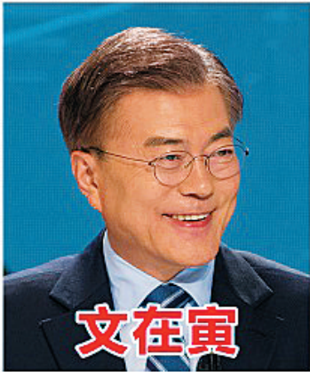
文在寅 共同民主党候选人