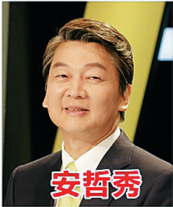
安哲秀 国民之党候选人