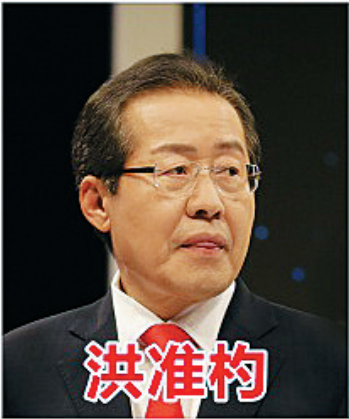
洪准杓 自由韩国党候选人