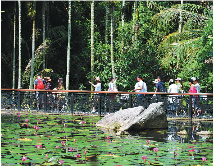
游客畅游三亚亚龙湾热带天堂森林旅游区。

赴三亚常出现“一票难求”局面;酒店预订亦呈火爆趋势,“五一”期间,三亚优质湾区酒店热门,亚龙湾、海棠湾等度假湾区旅游饭店出租率超过70%,高于该市64.2%的平均开房率,优质的服务、精细化的产品,成为高端酒店揽金抓手。