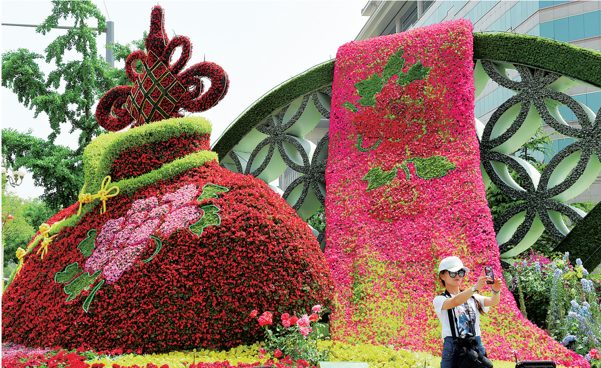
5月9日，北京市民在为迎接“一带一路”国际合作高峰论坛布置的花坛前留影。

举行政策沟通、加快基础设施联通、推动贸易畅通等6个平行主题会议。 据了解，高级别会议将有1500多名中外嘉宾参会，其中包括850多位外方嘉宾，涵盖130多个国家和70多个国际组织。