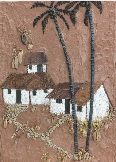
用酒瓶碎片、报纸和咖啡渣等制作的《椰树小路》。