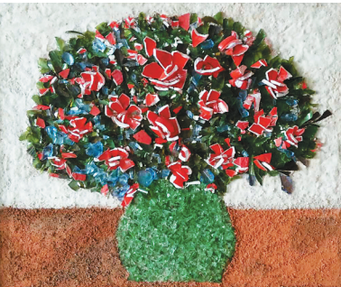
用不同颜色碎玻璃制作的画。