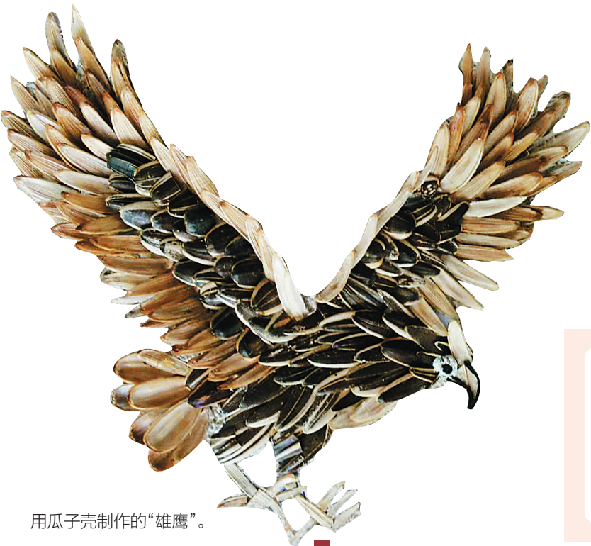
用瓜子壳制作的“雄鹰”。