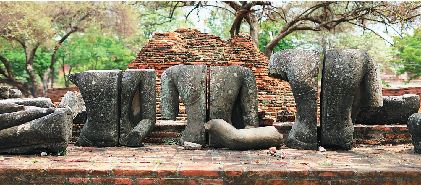
大城府中破损的雕像。

蓦然想起，小时在海口，常能看到卖货郎叫卖鲜花制成的胸针、头饰和手链，可惜那样的光景早已消逝，如今竟只可在异国他乡寻回一丝旧日乡愁。