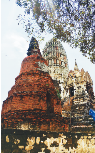
阿瑜他耶历史公园遗址。