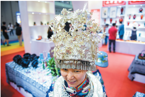
重庆酉阳苗族参展商在文博会重庆展台展示银饰。

15日，4月份工业、投资、消费等宏观经济数据集中发布，各项数据尽管短期有波动，但仍保持相对平稳。国家统计局新闻发言人邢志宏说，4月份，国民经济继续保持总体平稳、稳中向好的发展态势。 中国经济“稳”在哪？从生产和需求来看，4月份，全国规模以上工业增加值同比增长6.5%，增速比去年同期加快0.5个百分点；全国服务业生产指数同比增长8.1%，今年以来一直保持在8%以上的较高水平。需求方面，投资保持较快增长，特别是基础设施投资高位运行；社会消费品零售总额保持两位数增长，网上零 售也实现高速增长；外贸延续了回稳向好态势。 值得注意的是，与3月份相比，4月份工业增加值等指标当月增速有所回落。专家分析，这主要是受到今年“五一”小长假提前、工作日同比减少一天的影响，是在合理范围内、预期范围内的短期波动，不影响指标向好的趋势。 4月份，全国规模以上工业增加值增速比3月份回落了1.1个百分点。除了“五一”小长假提前的短期月度因素外，国家统计局工业司高级统计师江源认为，这是在3月份增速短期加快后的正常回归，4月当月的增速仍高于去年以来多数月份的增长水平。 观察中国经济，总量固然重要，结构更为关键。从数据来看，供给侧结构性改革取得积极进展，产业结构、需求结构、投资结构等也在持续优化。 国家统计局披露，在去产能方面，截至目前，今年钢铁去产能已完成3170万吨，煤炭完成6897万吨，完成进度分别达到63.4%和46%。去库存方面，4月末全国商品房待售面积同比下降7.2%，降幅比3月末扩大0.8个百分点。去杠杆方面，3月份，规模以上工业企业资产负债率同比下降0.7个百分点。降成本方面，1至3月份，规模以上工业企业每百元主营业务收入中的成本同比下降了0.15元。在补短板方面，生态保护和环境治理业、公共设施管理业等短板领域的投资力度进一步加大。 “总的来看，4月份经济运行延续了稳中向好的态势，积极因素继续增加。但也要看到，国内外环境依然复杂多变，结构性矛盾尚未根本缓解，一些新情况新问题需要密切关注。”邢志宏说。 当前，中国经济增长内生动力仍需增强，部分行业产能过剩，地区经济走势分化。统计显示，4月份，东北地 区规模以上工业增加值增速仅为1.6%，尽管比一季度有所提高，但与全国相比仍然较低。1至4月份，民间投资同比增长6.9%，尽管增速比去年全年提高了3.7个百分点，但与一季度相比有所回落。 邢志宏表示，下阶段，要坚持稳中求进工作总基调，坚持以供给侧结构性改革为主线，继续适度扩大总需求，大力深化创新驱动，注重加强预期引导，全面做好稳增长、促改革、调结构、惠民生、防风险各项工作，确保经济平稳健康发展。 记者陈炜伟 (新华社北京5月15日电)