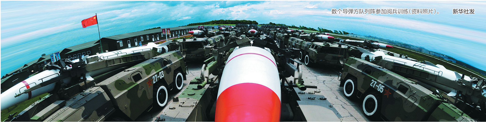
数个导弹方队列阵参加阅兵训练(资料照片)。 新华社发