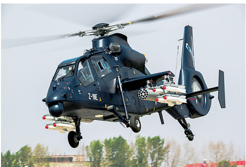
5月18日,我国自主研制的出口型武装直升机直-19E在哈尔滨首飞。

不做清谈馆,要当行动队。在推动“一带一路”建设和全球治理变革中,中国崇尚实干的精神是推石上坡的重要引擎。当前,制约世界经济复苏和增长的,是阻碍创新的壁垒没有突破,是垄断要素的沟坎没有联通。“一带一路”建设旨在打造包容开放的国际合作平台,是中国为世界提供的重要公共产品。这一中国倡议之所以能够得到这么多国家欢迎,正是因为做的是好事、干的是实事。此次论坛收获了丰富成果,下一步需要把共识转化成行动,一步一步扎实推进、一点一滴深化落实,让“一带一路”建设行稳致远。 有国际媒体说,“一带一路”建设正书写经济全球化的新篇章。与参与各方携手同行,中国努力开掘推动世界经济持续增长的动力源泉,为构建和平繁荣的人类命运共同体提供动力支撑。沿着这条充满希望的道路走下去,人类必将迎来一个更加美好的明天。(新华社北京5月18日电)