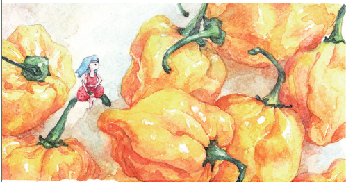
海南黄辣椒写生图。