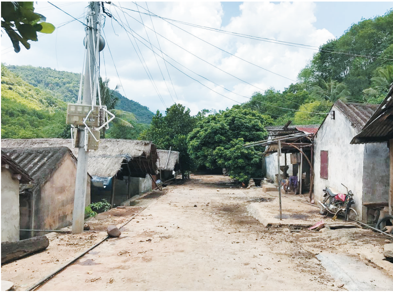
↑ 浪论村旧貌 ← 浪论村新貌

笔开销,但她却花得爽快,更有些自豪。 那是在2015年,昌江启动了浪论村整村推进扶贫项目,用政府出一点、企业出一点、村民筹一点的方式,给全村64户村民盖上了新房。2016年1月8日迁入新居的那天,刘桂芳直言5.04万元这笔钱出得值。 “虽然积蓄都投了进去,但县里的好政策让在读职校和初中的孩子们学费生活费几乎全免,每个月只需300元生活费,住进新房子也定了,要想办法好好赚钱致富啦。”房子有了、路通了,孩子上学的压力没了,刘桂芳身上的担子也慢慢轻了。 还记得刚嫁到浪论村的日子,住的是茅草土坯房,过的种植山兰糊口的苦日子。“不管是种菠萝还是种橡胶,交通条件差,怎么都卖不出去。”刘桂芳回忆道,那时候的村子里,每个月开销收入不过是四五十元,见过