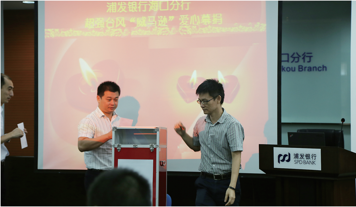
2014年，浦发银行海口分行发动员工为威马逊超强台风灾区捐款。

心公益，多次开展贫困学生资助、赈灾爱心捐赠、公益活动赞助等活动，涵盖教育、文化、卫生、扶贫、救灾等多个领域。