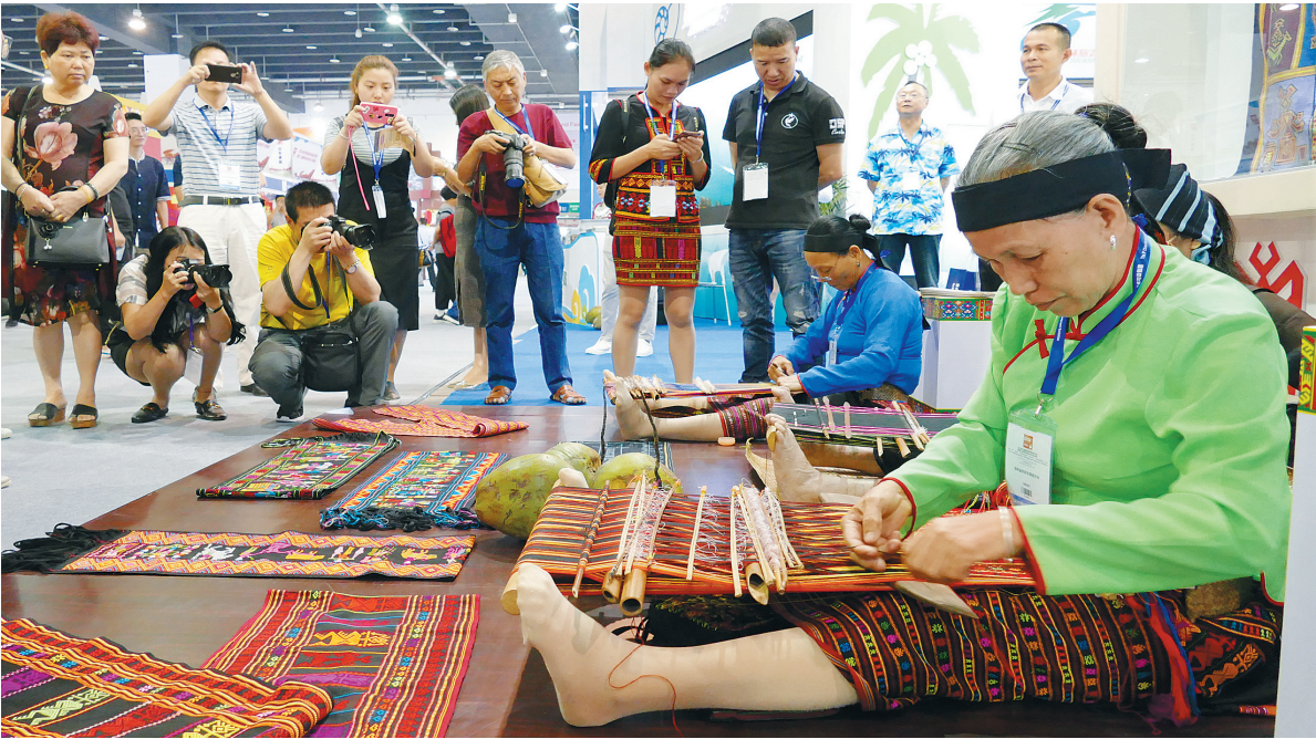
海南展馆内，黎族阿妈现场织黎锦，吸引许多观众驻足拍照。

“今年的展位比去年大很多，参展商品数量更多，种类也愈发多样化、专业化。”第二次参加旅博会的海南旅游商品品牌“尧香堂”相关负责人告诉记者：“我们去年带来的旅游商品以特色美食为主，今年还带来了驱蚊膏、椰油膏、化妆品等非常具有海南特色的旅游商品，受到了