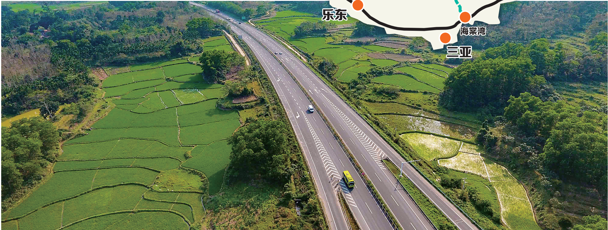
高速公路对经济发展有着巨大带动作用,图为海屯高速公路。