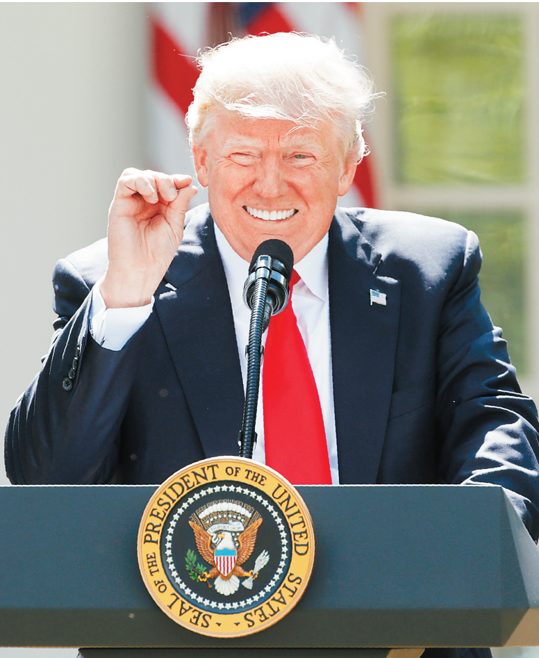
6月1日,特朗普在白宫发表讲话,宣布退出《巴黎协定》。

上任伊始,特朗普政府就在气候变化政策上“开倒车”。首先,他致力于推迟并推翻前任政府限制温室气体排放的环保政策,承诺复苏长期低迷的美国煤炭业;其次,他还要求评估修改奥巴马政府制定的旨在减少发电厂碳排放的《清洁电力计划》;再者,特朗普政府提出的2018财年联邦政府预算也提议停止向一些联合国应对气候变化项目拨款,并大幅削减美国环保局的预算。