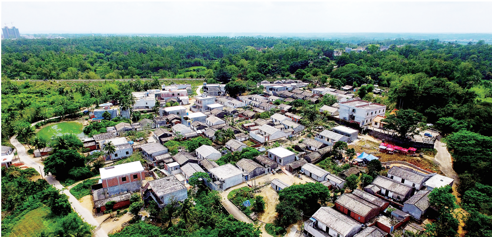
岑家梧故里——澄迈县永发镇岑后村。