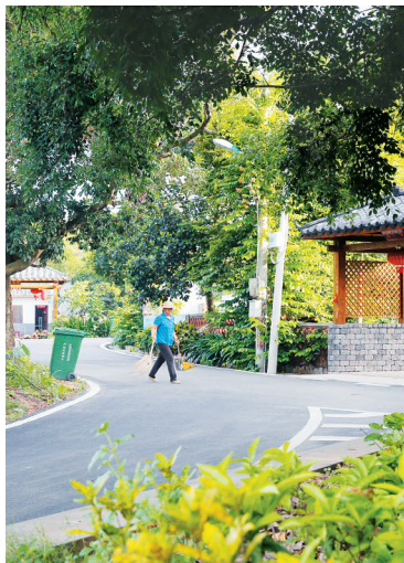
儋州市那大镇洛南村委会力作村干净整洁。