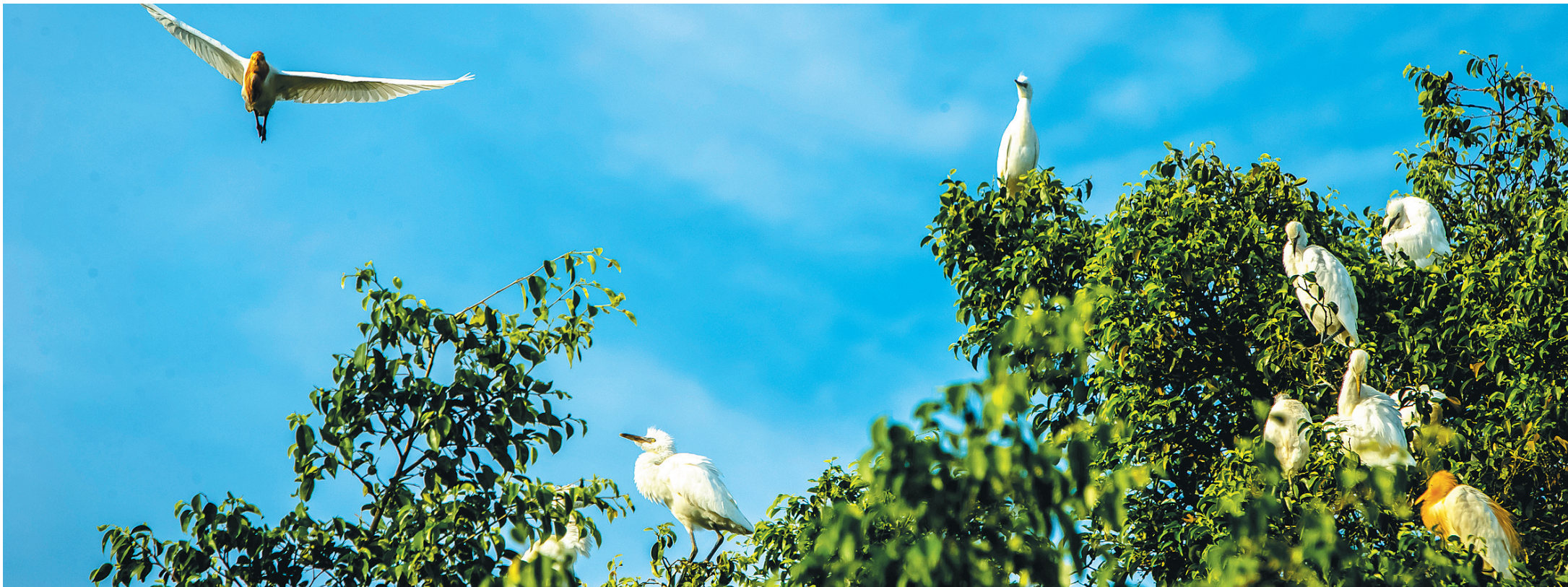
儋州市那大镇屋基村的大榕树上，栖息着数只亚成体白鹭、牛背鹭。本报记者 苏晓杰 特约记者 吴文生 摄