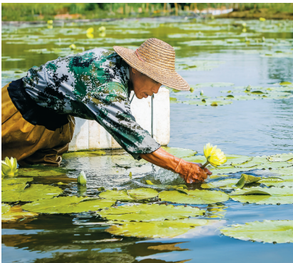
儋州市南丰镇和疋村的村民在自家稻田改造的水塘里采摘台湾九品香水莲花。