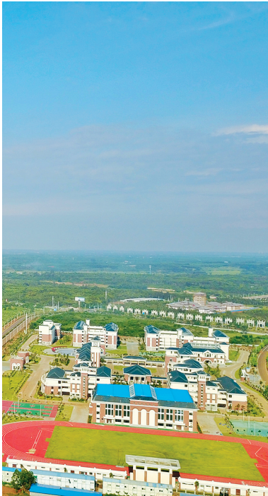
鸟瞰临高澜江新城美景。