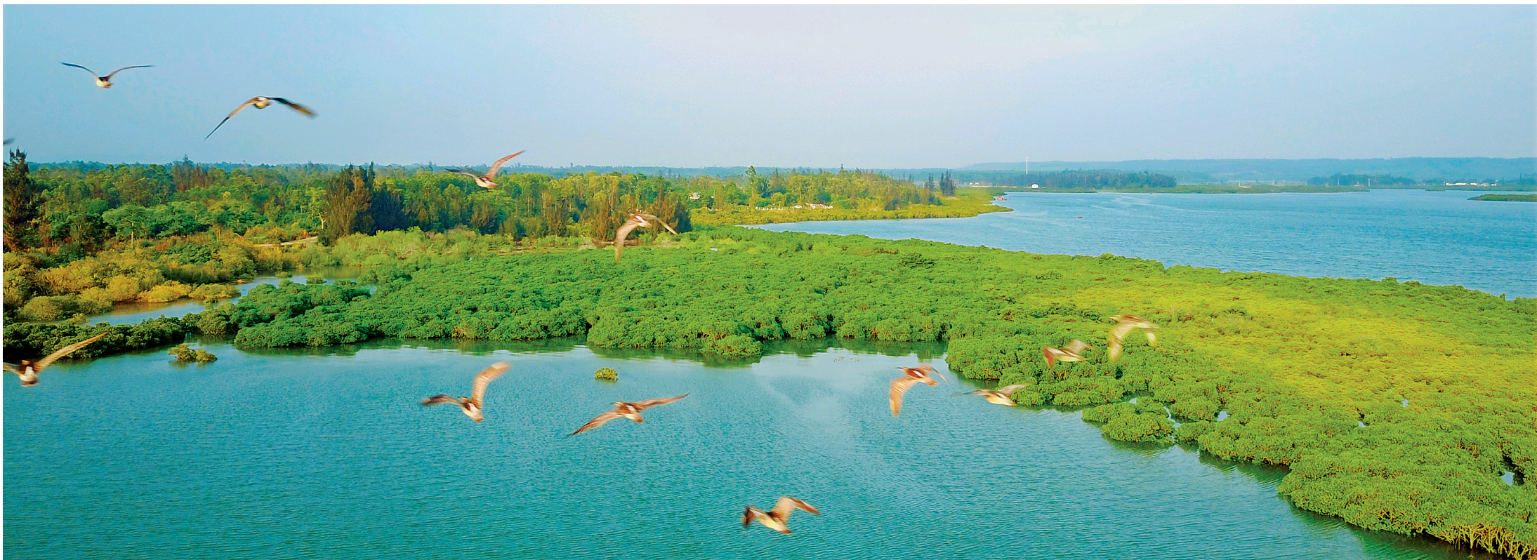
临高县新盈镇彩虹红树林风景如画。