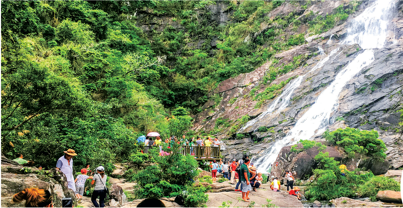
↑ 游客在大里瀑布游玩。 ➡ 大里立面改造后的房屋很有黎族特色。

家庭农场、农村电商等非企业生产经营主体，为他们免费提供相关技能培训和食宿的指定培训点，组织他们到企业就业的经营性人力资源服务机构、劳务经纪人，均可获得政府补贴。补贴数额按帮扶人口数计算，例如，每吸纳一人就业，可获得1000元补贴；通过培训使他们得到电工证、驾驶证等证书的，将获得4400元/人的补贴。 据统计，相较于去年，陵水今年就业扶贫成效更大，去年实现贫困劳动力转移就业931人，而今年仅1月至5月就实现劳动力就业转移968人。