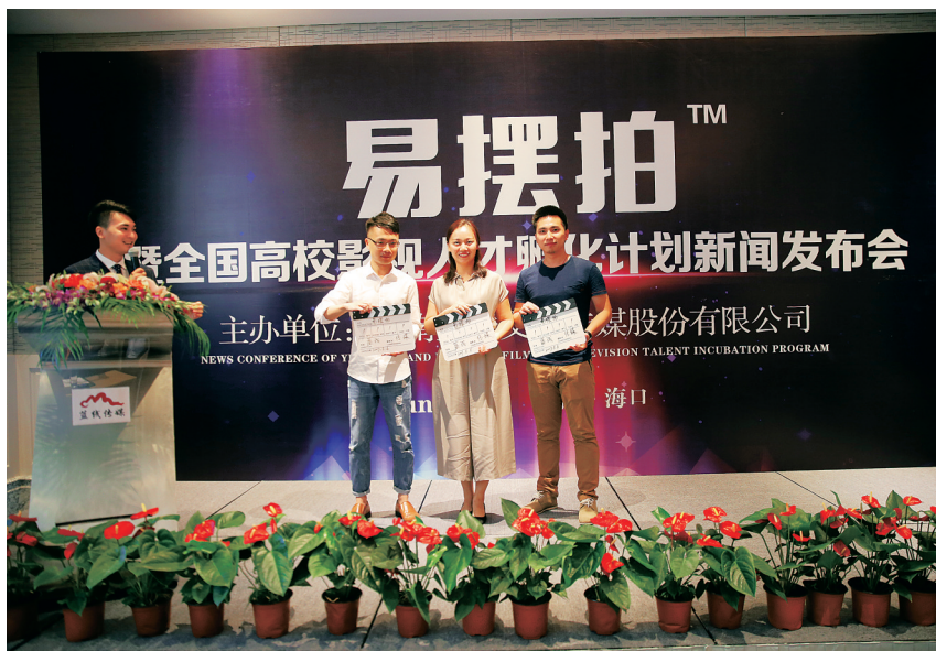
易摆拍项目主创人员以“打板”形式宣布项目正式启动