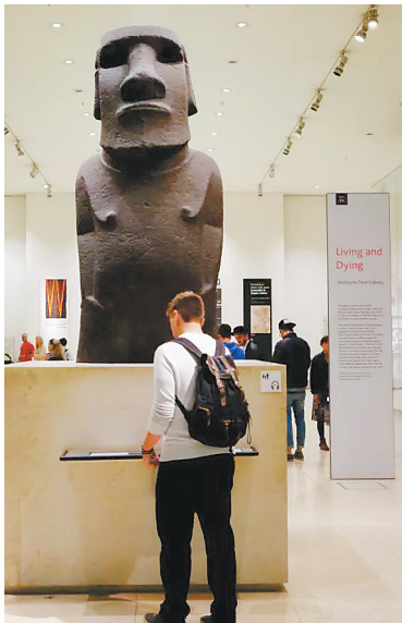
在大英博物馆参观的青年。