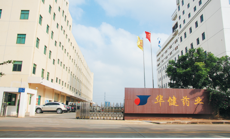
海南华健药业有限公司办公大楼。

业务,并辐射全岛。其第三方物流服务,可根据客户不同需求,实现特色定制;互联网医药服务,可实现二十四小时轻松网上购物;新特药营销事业部,鼓励大众创业,实现营销创新和管理创新;同时,开展GSP共享仓库和办公和经营租赁业务。