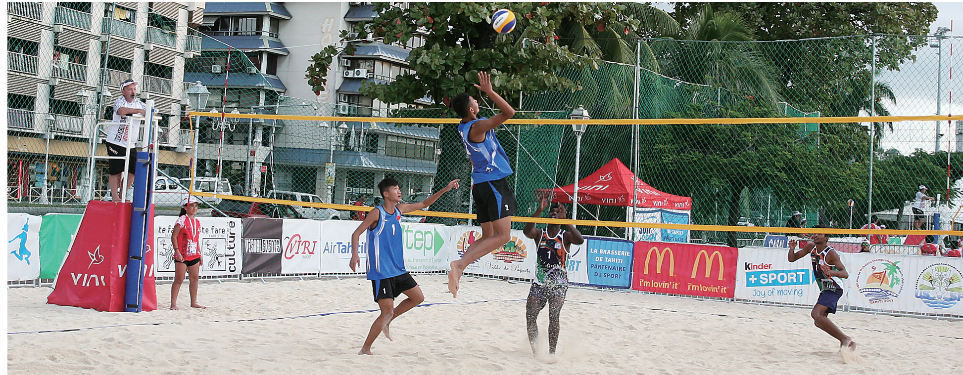
日前,在第四届世界中学生沙滩排球锦标赛小组赛中,澄迈二中男子排球队迎战印度代表队。