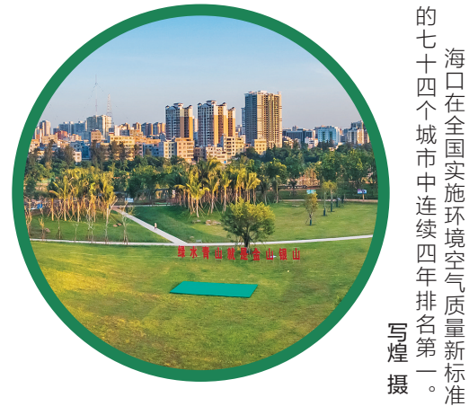
(本版策划/统筹 一豪 秀英)

本报椰林6月11日电 (见习记者李艳玫 通讯员符宗瀚)近日,陵水黎族自治县新村镇有一养殖户的军曹鱼出现大规模死亡。此事引起陵水县海洋与渔业局的高度重视,专门邀请了海南热带海洋学院专家实地察看,并对水体进行采样调查。6月10日上午,经陵水海洋与渔业局工作人员和海南热带海洋学院生命科学与生态学院副教授李由明调查发现,现场出现死鱼的渔排已被单独分离出来,相关工作人员正在打捞清理滞留在网箱内的死鱼。据新村镇政府工作人员介绍,死鱼数量约20万斤,损失300多万元。“这一事件主要是由于渔排养殖密度过大,碰上陵水连日下雨,咸淡水交替,导致水中溶氧量降低,从而造成军曹鱼大规模缺氧死亡。”李由明表示,水体水质情况还待进一步的检测。为避免死鱼影响水质以及周边渔排居民的生活,陵水海洋与渔业局及时联合新村镇政府、环卫单位,出动3艘执法艇以及15名执法人员帮助养殖户将渔排拖离处理,用吊车将死鱼运走掩埋,做无公害化处理;并请求省海洋监测预报中心对水质进行监测,同时告知周边养殖户及时对网箱打氧并控制养殖密度,避免出现同类事件造成经济损失。李由明说,养殖户要控制好养殖密度,不能过密;遇连续阴天以及养殖户出现游动慢等情况要及时打氧,确保其所需氧气充足。