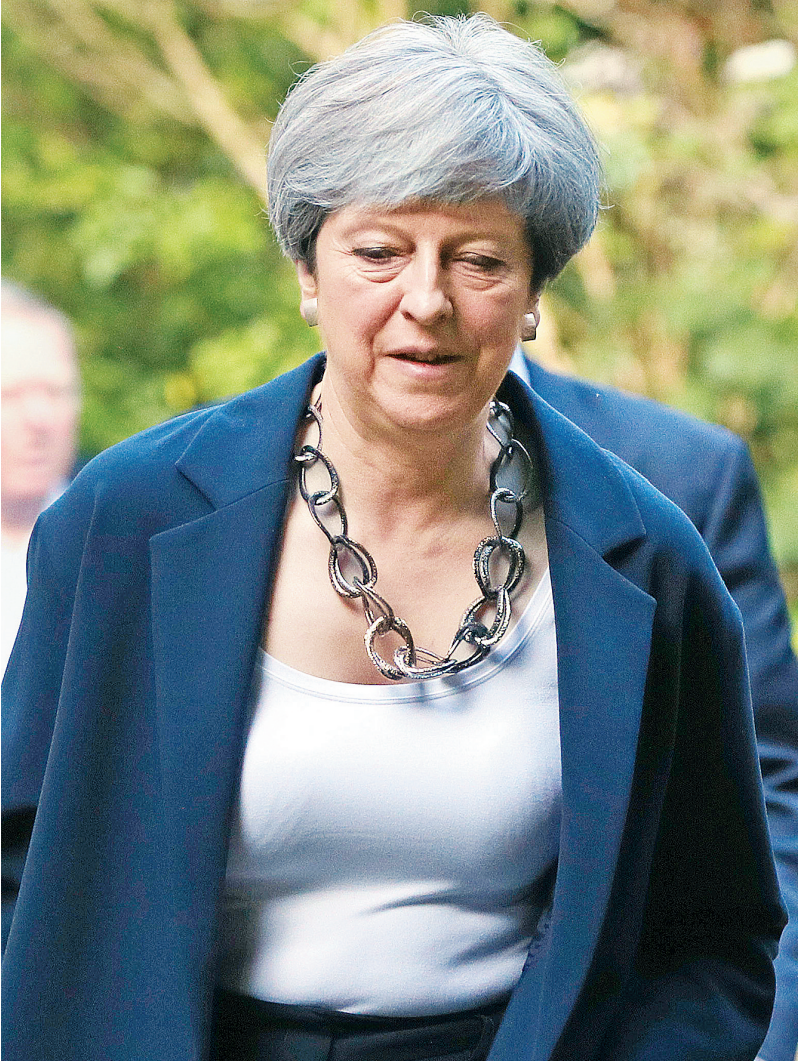
6月11日，英国首相特雷莎·梅抵达一座教堂参加活动。