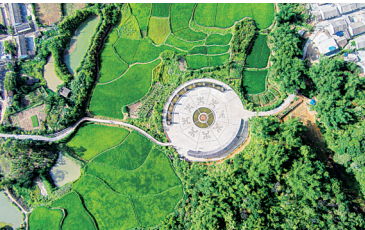
琼中什寒以“原生态风光、黎苗风情、淳朴民风”向世界递交了自己的名片。