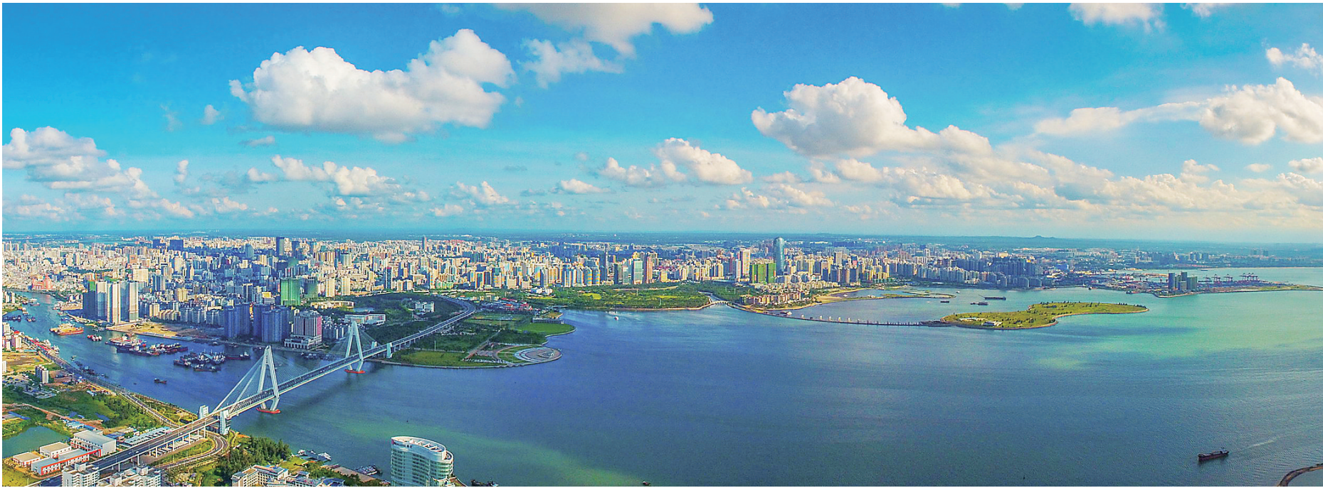
鸟瞰海口万绿园世纪公园一带景观。