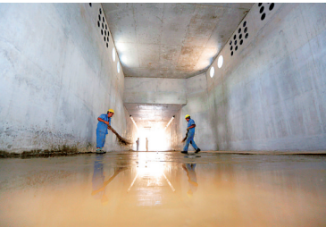
海口地下管廊项目加紧施工，部分路段管廊主体完成。