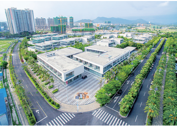
俯瞰陵水清水湾国际信息产业园。

这个从海南日报社流出的“号码”——“1633-2222-12651”，或许能为理解“美好新海南”提供全新的思维方式。这是一个特殊“号码”，一个以实质内容为依托的数字组合，有人说这是通往省第七次党代会精神的“机要密码”，有人说这是拨向加快建设美好新海南的“电话号码”，也有人说这是新起点上的海南的“身份号码”。无论是哪一种，都说明这个“号码”非常重要。人们不禁想问：这个“密码”真的如此重要？且看分解。