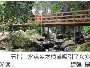
五指山水满乡木栈道吸引了众多游客。

炎炎夏日,酷暑难耐。进 入六月以来,我省迎来持续 的高温天气,不少市民都在考虑 去哪里纳凉消暑? 地处海南 中部山区的五指山市,由于森 林覆盖率高,热带雨林分布广 泛,这里冬暖夏凉,成了避暑 的好去处。 五指山市有着“天然氧 吧”“翡翠山城”的美称,由于 海拔高、纬度低,森林密布, 光、热、水资源丰富,年平均气 温22.4℃。独特的气候条 件,使五指山生物种类繁多, 植被分布为热带自然景观,美 不胜收。