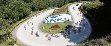
环岛赛选手经过五指山曲折回转的S形山路。

漫步雨林探秘 茂盛的树木遮天蔽日,山涧里泉水 叮咚流淌,漫步在五指山区热带雨林中, 扑面而来的是纯净的空气和满目的葱 绿,让人流连忘返。 五指山区遍布热带原始森林,层层 叠叠,逶迤不尽。海南主要的江河皆从 此地发源,山光水色交相辉映,构成奇 特瑰丽的风光。五指山有森林面积860 平方公里。森林中木本植物1400种,高 级珍贵木材150多种,药用植物1000多 种,还有100多种名贵的兰花。 五指山动物种类繁多,许多生物种 属为五指山区所独有。五指山热带雨 林区有600多种蝴蝶,占中国蝶种的50%。 五指山热带雨林风景区集中了热带 山地雨林和热带沟谷雨林的典型景观, 景区内古树参天、藤萝密布,奇花异草 随处可见……由五指山原始森林中的山 泉汇聚而成的水满河清澈见底,动静 结合。看身边彩蝶飞舞,呼吸着富含氧 离子的清新空气,让人身心都沉醉在大 自然中。 五指山国家级自然保护区内的栈道 两旁,你会看到一块块挂在树上的牌子, 上面是各种植物的介绍,一边呼吸着高 含量负氧离子的空气,一边进行科普,让 你的热带雨林之旅变得更加有意义。 热带雨林如此迷人,心动不如行动, 背起你的行囊,走出空调房,朝海南中 部山区雨林进发吧,常在海边游玩的你, 会认识不一样的五指山。 感受浪尖激情 五指山独特的山体地形以及热带雨 林景观,造就了五指山国内漂流胜地的 美誉。峡谷奇石林立,千姿百态,山间 河水清澈,河湾急缓交错,船行其间忽 左忽