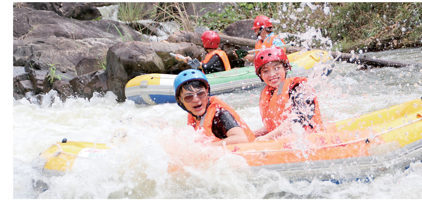
游客在体验惊险刺激的五指山大峡谷漂流。

漫步雨林探秘 茂盛的树木遮天蔽日,山涧里泉水 叮咚流淌,漫步在五指山区热带雨林中, 扑面而来的是纯净的空气和满目的葱 绿,让人流连忘返。 五指山区遍布热带原始森林,层层 叠叠,逶迤不尽。海南主要的江河皆从 此地发源,山光水色交相辉映,构成奇 特瑰丽的风光。五指山有森林面积860 平方公里。森林中木本植物1400种,高 级珍贵木材150多种,药用植物1000多 种,还有100多种名贵的兰花。 五指山动物种类繁多,许多生物种 属为五指山区所独有。五指山热带雨 林区有600多种蝴蝶,占中国蝶种的50%。 五指山热带雨林风景区集中了热带 山地雨林和热带沟谷雨林的典型景观, 景区内古树参天、藤萝密布,奇花异草 随处可见……由五指山原始森林中的山 泉汇聚而成的水满河清澈见底,动静 结合。看身边彩蝶飞舞,呼吸着富含氧 离子的清新空气,让人身心都沉醉在大 自然中。 五指山国家级自然保护区内的栈道 两旁,你会看到一块块挂在树上的牌子, 上面是各种植物的介绍,一边呼吸着高 含量负氧离子的空气,一边进行科普,让 你的热带雨林之旅变得更加有意义。 热带雨林如此迷人,心动不如行动, 背起你的行囊,走出空调房,朝海南中 部山区雨林进发吧,常在海边游玩的你, 会认识不一样的五指山。 感受浪尖激情 五指山独特的山体地形以及热带雨 林景观,造就了五指山国内漂流胜地的 美誉。峡谷奇石林立,千姿百态,山间 河水清澈,河湾急缓交错,船行其间忽 左忽