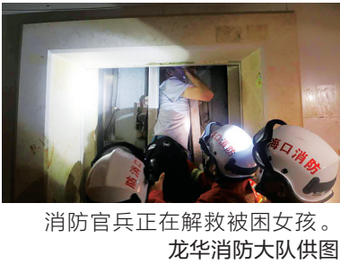
消防官兵正在解救被困女孩。

的电梯里接下来。 救出女孩后，大家发现女孩的右膝盖内侧有一块血淋淋的伤口，女孩说该伤口是电梯在快速上升至顶部时，巨大的撞击使电梯顶部的顶棚坠落，将右膝盖内侧砸伤。 目前，受伤女孩仍在医院接受治疗。据了解，海口质监局已对这起由电梯引发的被困事故进行调查。