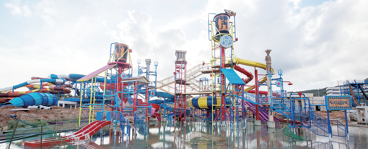
6月13日，省重点项目陵水富力海洋公园水公园区游乐设备安装完成，即将进入调试运行阶段。据悉，富力海洋公园总体进度过半，明年年中具备开业条件。