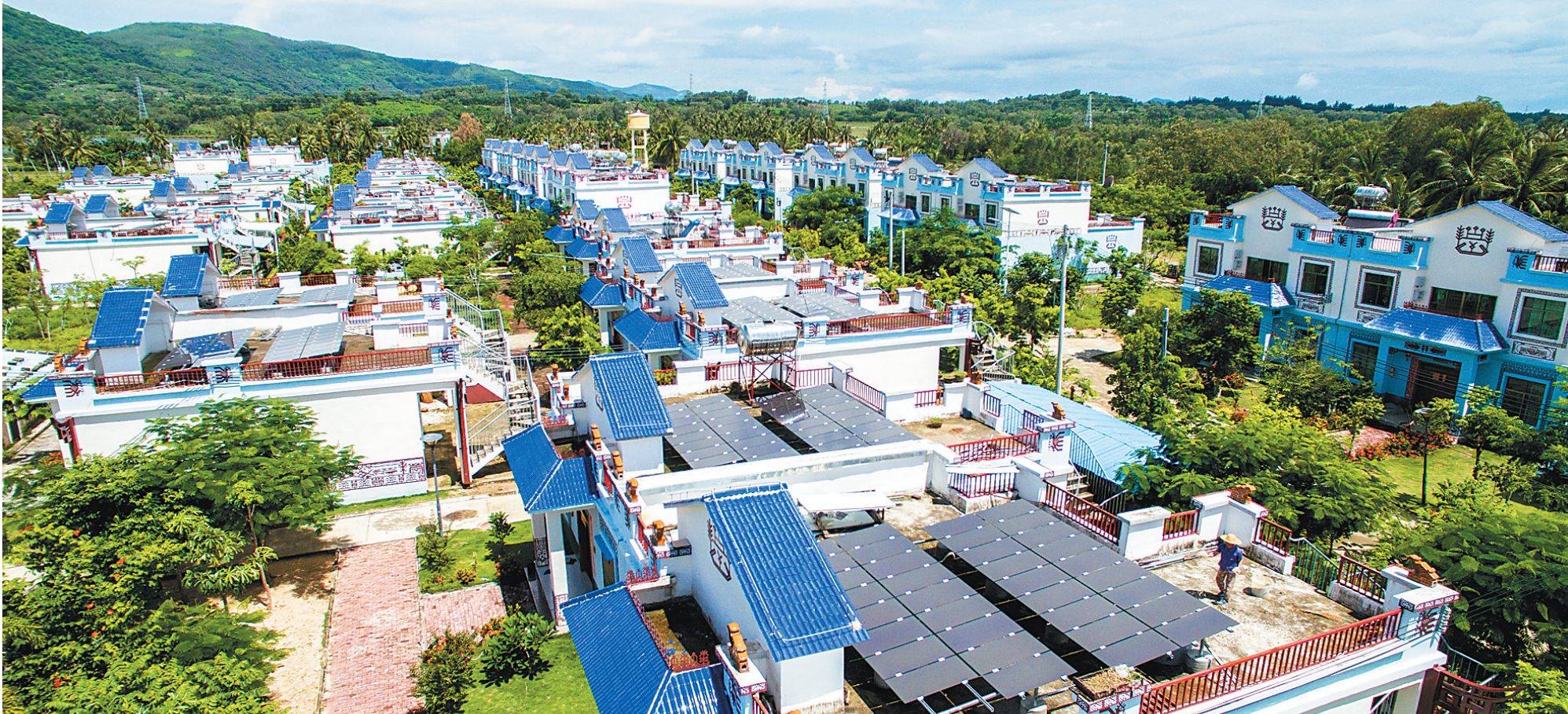
6月13日，低空俯瞰陵水黎族自治县隆广镇石关村常皮村村民小组，村民房顶的光伏发电系统已并网发电。

会办公楼等公共集体建筑屋顶，建设村、镇级分布式光伏电站；二是在建档立卡贫困户危房改造后的房屋屋顶建设3千瓦分布式光伏电站。今年计划在全县剩余3099户贫困户危房改造后的房屋屋顶建设总装机容量为9761.85千瓦的分布式光伏电站。全县光伏扶贫工程所有项目完成后将惠及4449户贫困户，每年为贫困户增加3000元至5000元的收入。