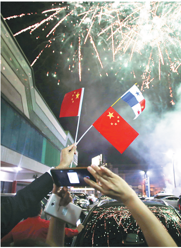
6月12日,在巴拿马首都巴拿马城的华人社区,人们在巴拿马与中国建交的庆祝活动中拍摄烟花。

2016年6月26日,中国远洋海运集团的“巴拿马”号货轮成为通过扩建后的新巴拿马运河的第一艘船舶。近一年后的今天,中国宣布与巴拿马正式建立外交关系。